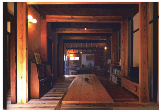
リブフレームによる耐震改修 動線や光や風を遮らずに補強が可能。 デザインとしても生かしながら。