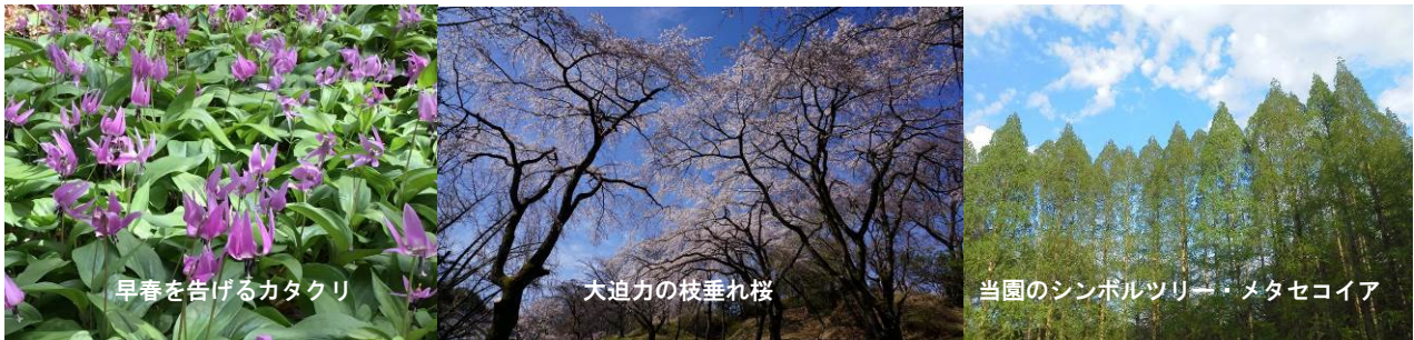
早春を告げるカタクリ

ぜひ皆さまに広くご周知いただき、ご取材についてご検討いただきますよう、どうぞよろしくお願い申し上げます。